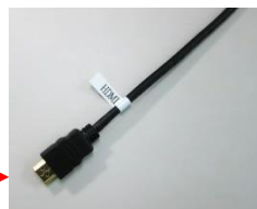
卓上HDMI入力ケーブル