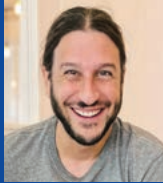
アントワヌ・ボウザ Antoine Bauza

世界的に著名なフランス人のボードゲーム作家アントワヌ・ボウザ氏のゲーム制作のノウハウについての講演を日本人ボードゲーム作家上杉真人氏の解説付きで伺う。その後、ワークショップでは、フランス語(同時通訳)を聞きながら実際に学生が4人一組でゲームをプレイしフランスのボードゲームの世界に親しむ。