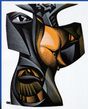
The Brothers Karamazov